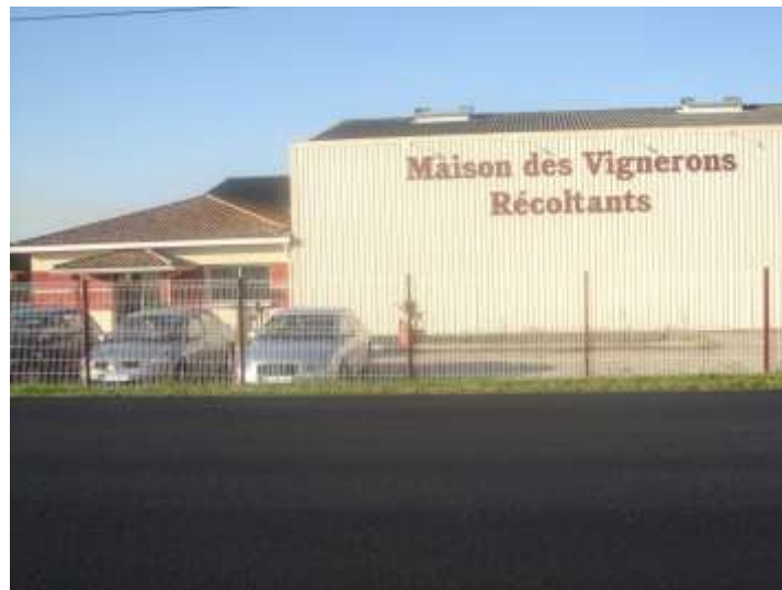
négociant en vins