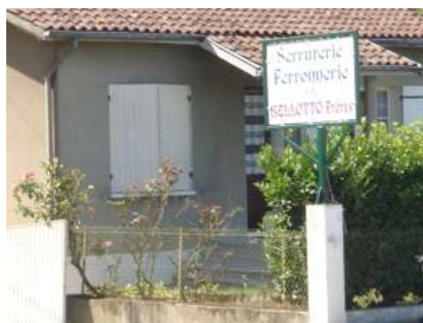
Serrurerie Ferronnerie Bellotto Frères