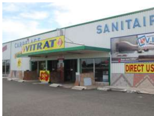
Vitrat carrelage / sanitaire