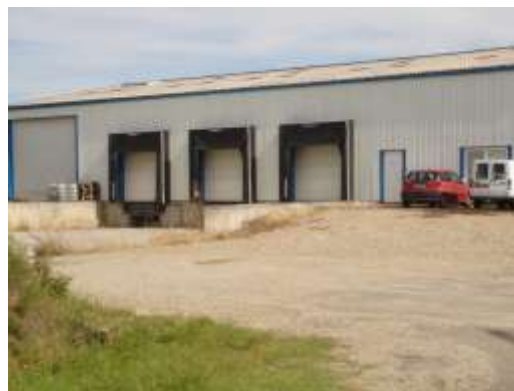
SCI des logis