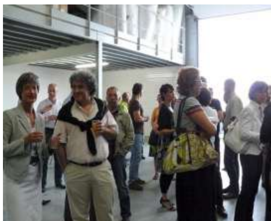
Générale des Achats 16 juin 2011

Inauguration de 2 entreprises sur la ZAC Croix de Lugat