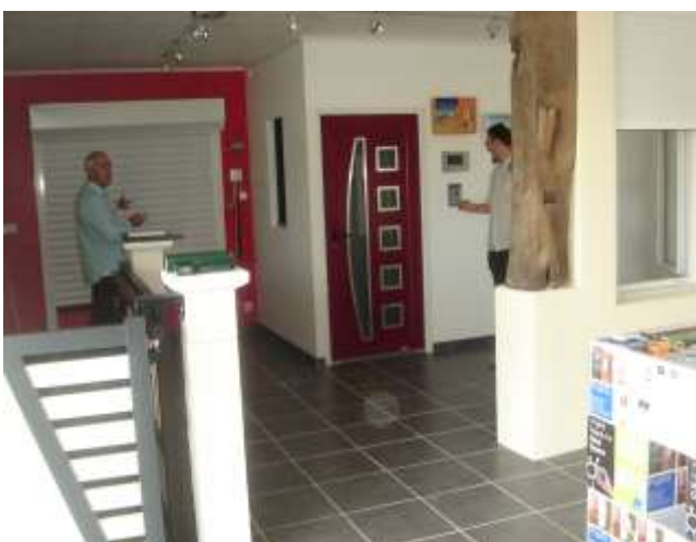
AFA (Automatismes Fermetures Aquitaine)