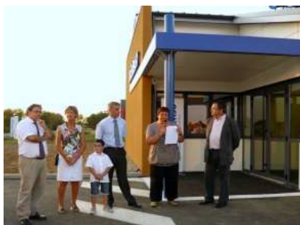
In Extenso 15 septembre 2011