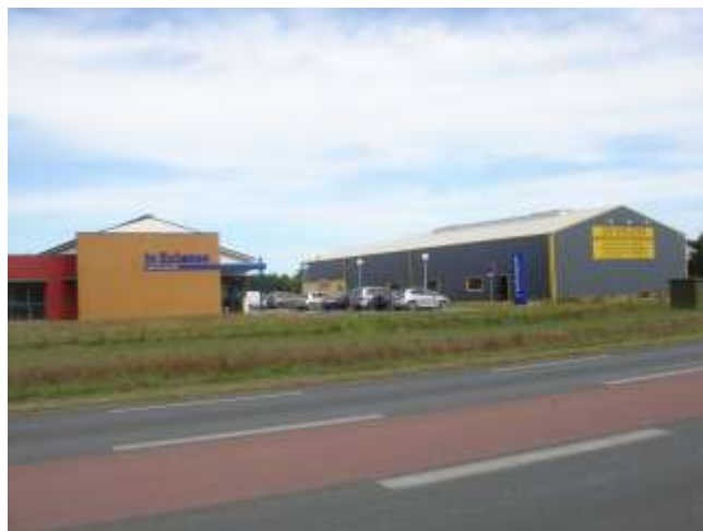
In extenso (cabinet d'expertise comptable) MGS Calorifuge (isolation thermique, phonique)