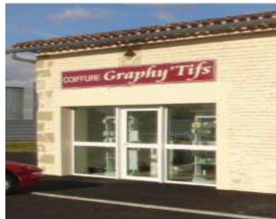
Salon de coiffure Graphy'tifs