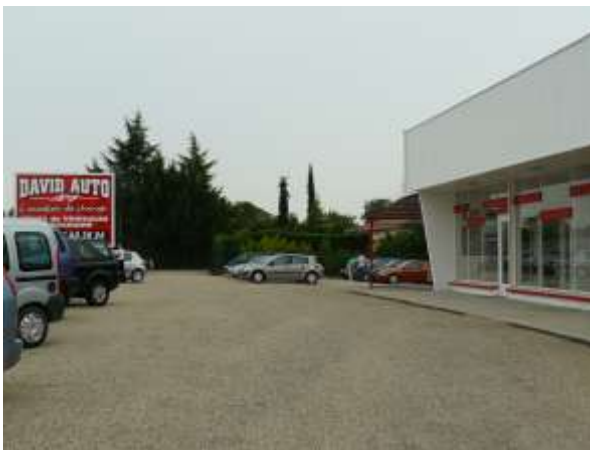
Concessionnaire David Auto