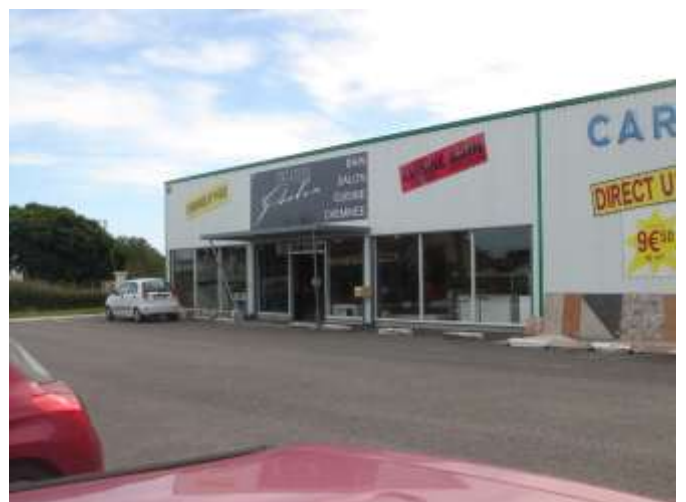
Création SELVA ( cuisines, salles de bains...)