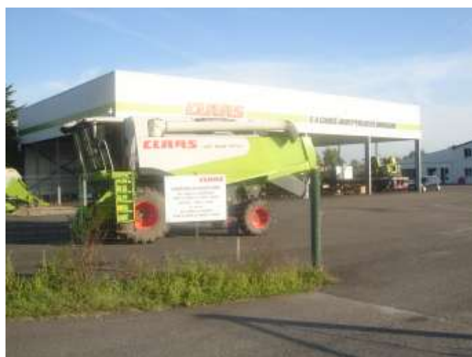
entreprise Cancé : moissonneuses batteuses