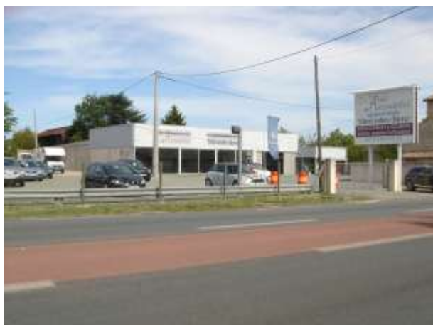
Concessionnaire Di Palma