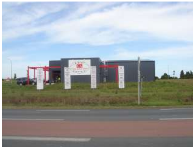
Générale des Achats (vente de produits d'entretien, d'hygiène, de vêtements, chaussures aux collectivités, entreprises et particuliers).