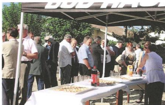
autour d'un apéritif dînatoire

Samedi 18 septembre : 4 ème Virades de l'espoir