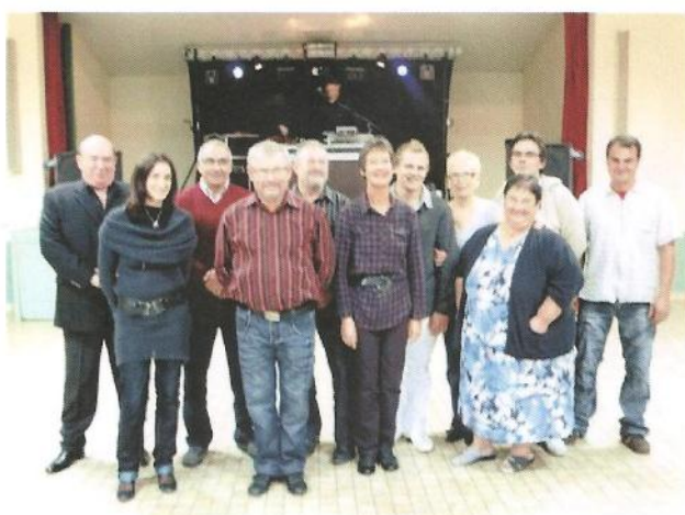
les présidentes et présidents des différentes associations entourent le maire

Samedi 30 octobre : soirée des associations communales