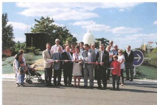
en présence des personnalités

Samedi 18 septembre : inauguration du giratoire "Croix de Lugat"