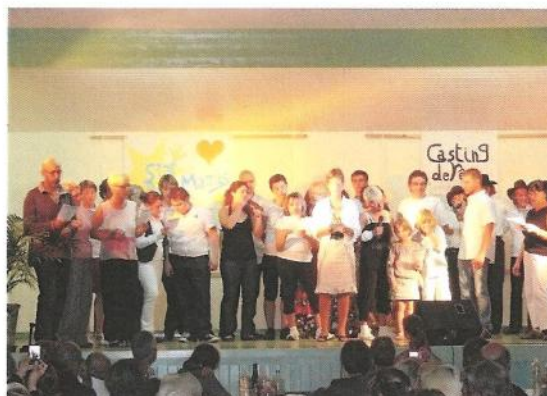
le final avec toutes les associations qui ont participé

Samedi 30 octobre : soirée des associations communales