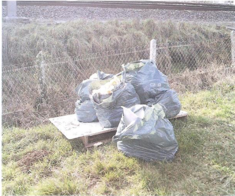
sacs poubelles remplis de déchets de plâtre et de laine de verre, destinés à la déchetterie et trouvés en bordure de la voie ferrée, sur la commune