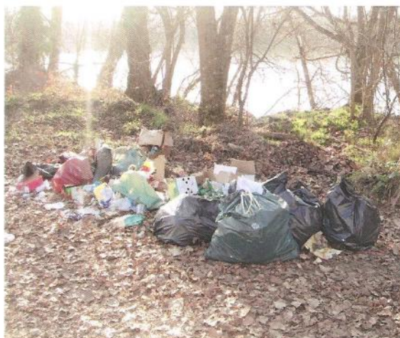
dépôt d'ordures trouvé en bordure de Garonne : inadmissible !

Un guide du tri et un calendrier de collecte vous ont été remis.